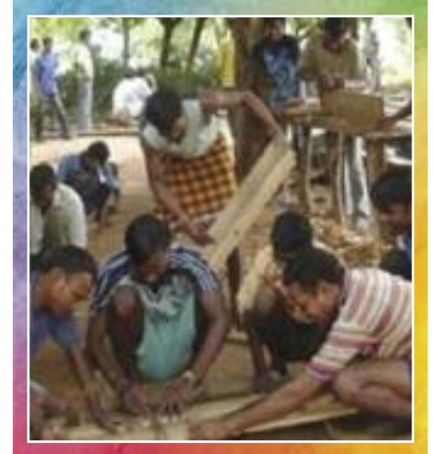
Deelnemers aan de opleiding tot timmerman

In het Nayagarh-district in de deelstaat Odisha vond een bijzonder scholingsproject plaats. In dit gebied bevinden zich 50 dorpen, vooral bevolkt door leden van de Kandha- en Santal-stammen. Het project was gericht op 300 werkloze drop-outs, zowel jonge mannen als meisjes en jonge vrouwen. Zij konden kiezen uit een groot aantal trainingen en opleidingen, namelijk computervaardigheden, opleiding tot timmerman of tot loodgieter, ambachtelijke bamboeverwerking, kaarsen maken, bijenteelt & honingverwerking, conservering & verwerking van groente en fruit en productie & promotie van maandverband. Voor alle deelnemers was er de training ondernemerschap, financiële vaardigheden, communicatie & persoonlijkheidsontwikkeling. Voor een derde van de deelnemers was er na afronding van de beroepsopleiding een stageplaats geregeld in een passende werkomgeving. Voor de overige deelnemers bood het project begeleiding bij het vinden van een arbeidsplaats zodat alle jongeren uiteindelijk in hun eigen onderhoud zouden kunnen voorzien.