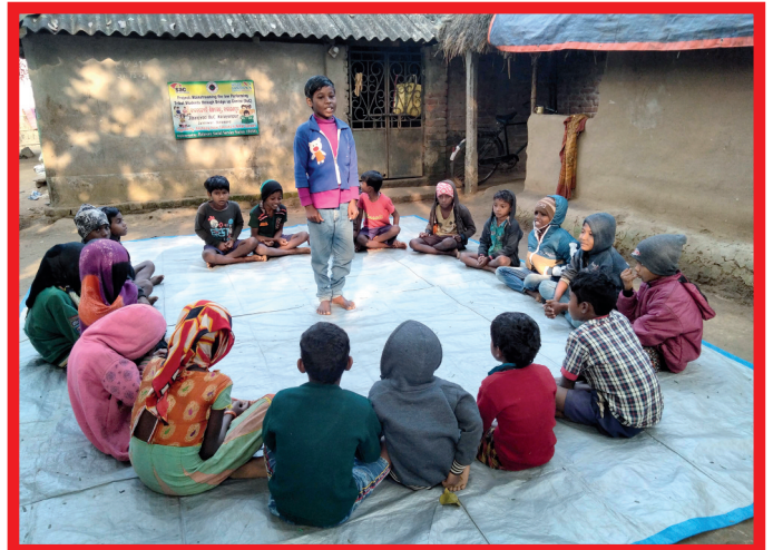
Kinderen leren in een kindersparlement discussiëren

in de loop der jaren hebben bestuursleden van SAC talrijke hostels bezocht en gezien hoe de kinderen er wonen en hoe ze liefdevol worden opgevangen door de hostelleiding. Kinderen hebben in een hostel ook veel kansen om zich te ontwikkelen door sport, dans, toneel, discussie en sociale activiteiten.