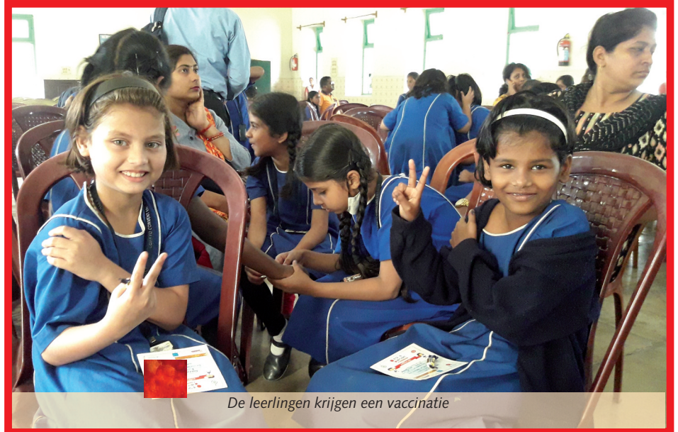
De leerlingen krijgen een vaccinatie

Op de Loretoschool in Calcutta hebben 15 ouderejaarsleerlingen dankzij sponsoring van SAC hun schooldiploma behaald. Deze school voor voortgezet onderwijs richt zich speciaal op kinderen van ouders met een economisch achtergestelde positie. En op het hostel bij de school wordt voorrang gegeven aan weeskinderen, halfwezen, kinderen uit gebroken gezinnen of meisjes in een kwetsbare positie. Wegens de enorme werkloosheid tijdens de pandemie en het daardoor toegenomen alcohol- en drugsgebruik waren veel ouders en verzorgers financieel niet meer in staat de school voor hun kinderen te betalen. SAC heeft voor hen het schoolgeld betaald en de schoolbenodigdheden, waaronder de boeken. Met het sponsoren van deze leerlingen heeft SAC bereikt dat deze jongeren met een diploma op zak de toekomst tegemoet gaan!