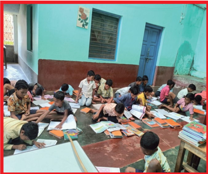
Huiswerkbegeleiding in een hostel

Tijdens het schoolseizoen verblijven de kinderen in het hostel, in de vakanties gaan ze naar huis en tussendoor kunnen de ouders hen komen opzoeken. Ook zijn er geregeld ouderbijeenkomsten om de ouders te informeren over de vorderingen van hun kinderen of over andere zaken.